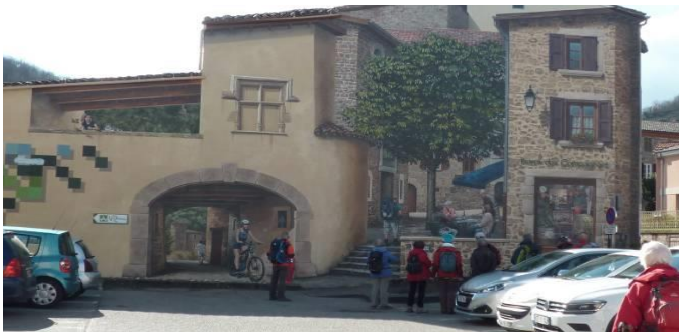
Chavanay trompe-œil avec une balise de st jacques et un pèlerin.

Retour sur Chavanay par les bords du Rhône mais que de vent. En guise de conclusion merci à tous, merci pour votre bonne humeur et votre entrain.