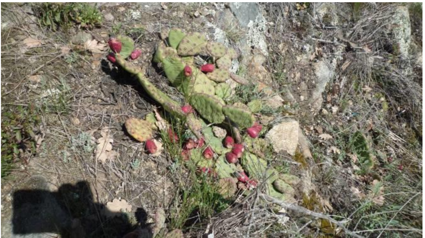
Figuier de barbarie à l'état sauvage

De nouveau une belle grimpette, dans les vignes s'affairent en musique de belles vigneronnes pour les délicats travaux de la vigne. Enfin c'est la dernière ascension la haut nous pourrons apercevoir le Rhône.