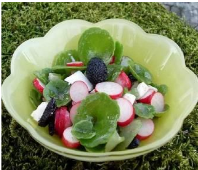
Recette Ombrilic en salade On le déguste aussi : poêlée avec une omelette