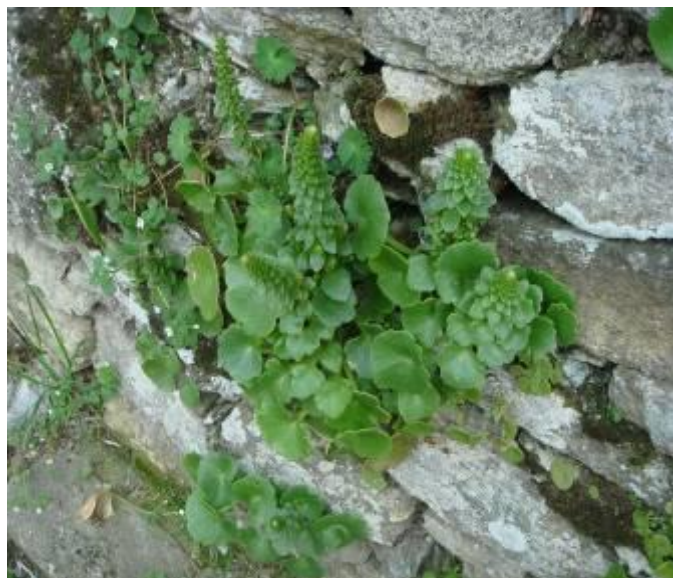
Ombrilic sur paroi granitique verticale (nombril de vénus).