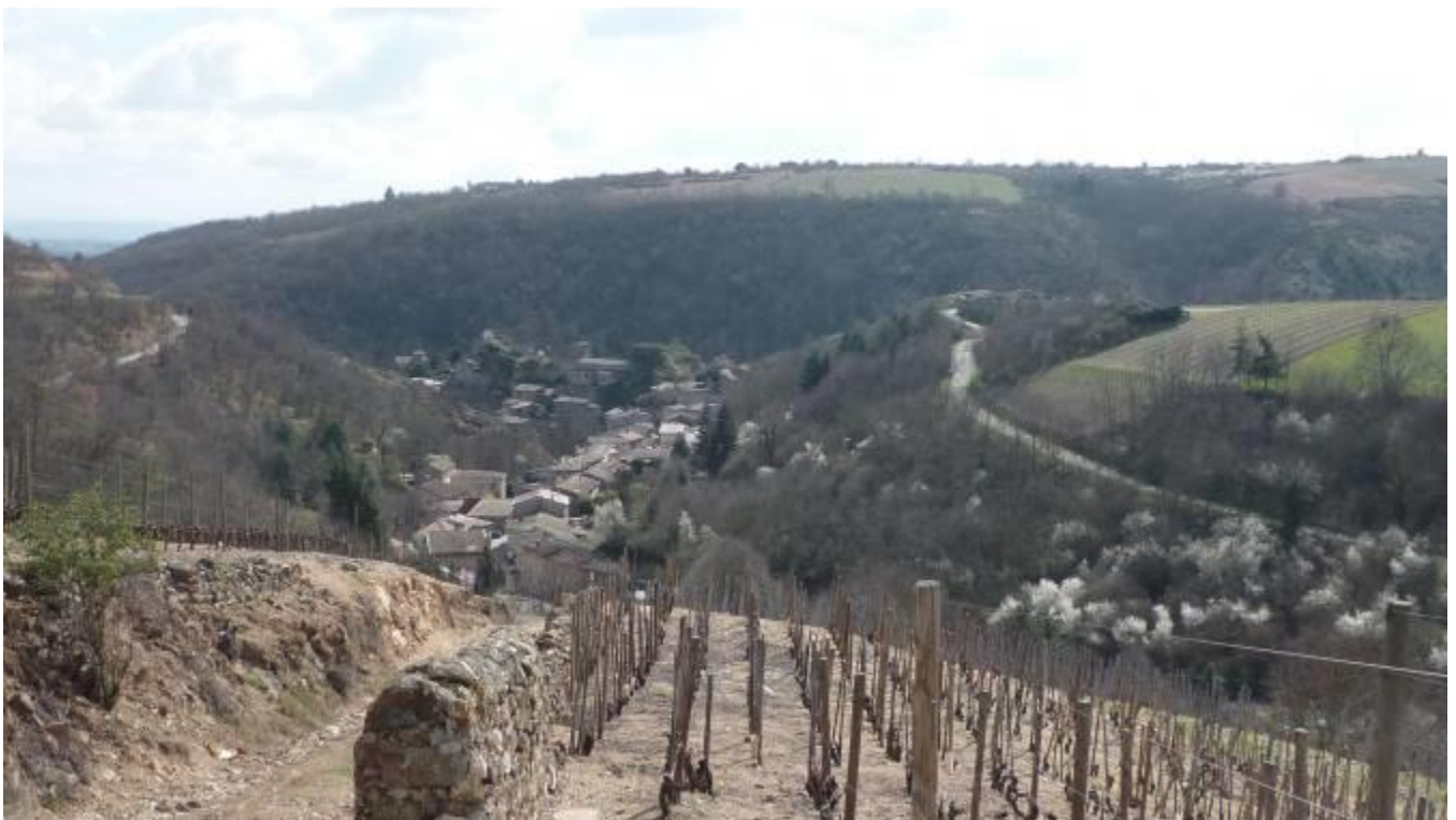
Malleval mais beau village

Sans aller trop vite, nous faisons de nouvelles connaissances en oubliant le temps qui passe. J'en oublie même le parcours pourtant bien balisé, heureusement cartes et GPS sur nos portables me remettent sur le chemin. Nous arrivons au dessus de Malleval, parcourons en zigzag les pentes abruptes du très respectable vignoble du St Joseph. La vue est superbe.